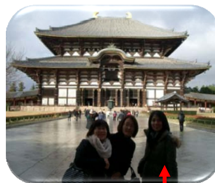
石橋です！ 息抜きで訪れた奈良東大寺にて